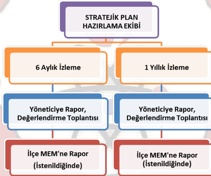
Ekil 2 - Stratejik Plan Uygulama Amaçları

Yıllık planın uygulanmasında yürütme ekipleri ve eylem sorumlularıyla aylık ilerleme toplantıları yapılacaktır. Toplantıda bir önceki ayda yapılanlar ve bir sonraki ayda yapılacaklar görüşülüp karara bağlanacaktır.